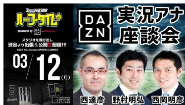
2018年3月12日（月）第4回 DAZN実況アナ座談会