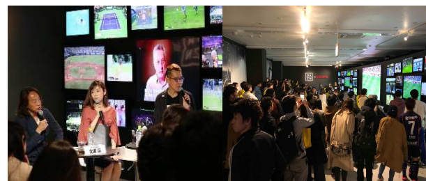
2018年3月18日（日）開催 明治安田生命J1リーグ ガンバ大阪対柏レイソル パブリックビューイングイベント

会場内で行ったJリーグのパブリックビューイングや、親子向けワークショップなど各種イベントの企画運営を行いました。