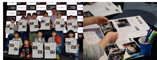
2018年3月24日（土）&25日（日）開催 スポーツ新聞を作ろう！ 野球記者体験イベント