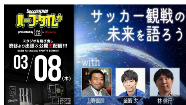
2018年3月8日（木）第2回 サッカー観戦の未来を語ろう