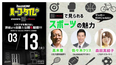
2018年3月13日（火）第5回 DAZNで見られるスポーツの魅力