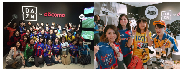
2018年3月11日（日）開催 Jリーグユニ女子会イベント