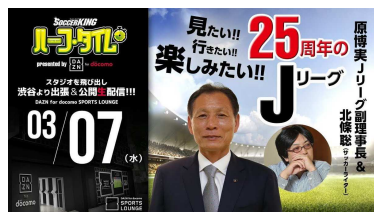
2018年3月7日（水）第1回 見たい!! 行きたい!! 25周年のJリーグ

サッカーキングが配信しているオンライン情報番組『サッカーキング ハーフタイム』を、期間限定でDAZN for docomo SPORTS LOUNGEから出張生配信しました。