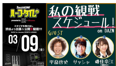
2018年3月9日（金）第3回 私の観戦スケジュール