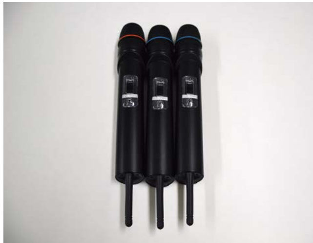
ワイヤレスマイク