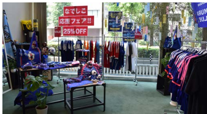
ショップスペース