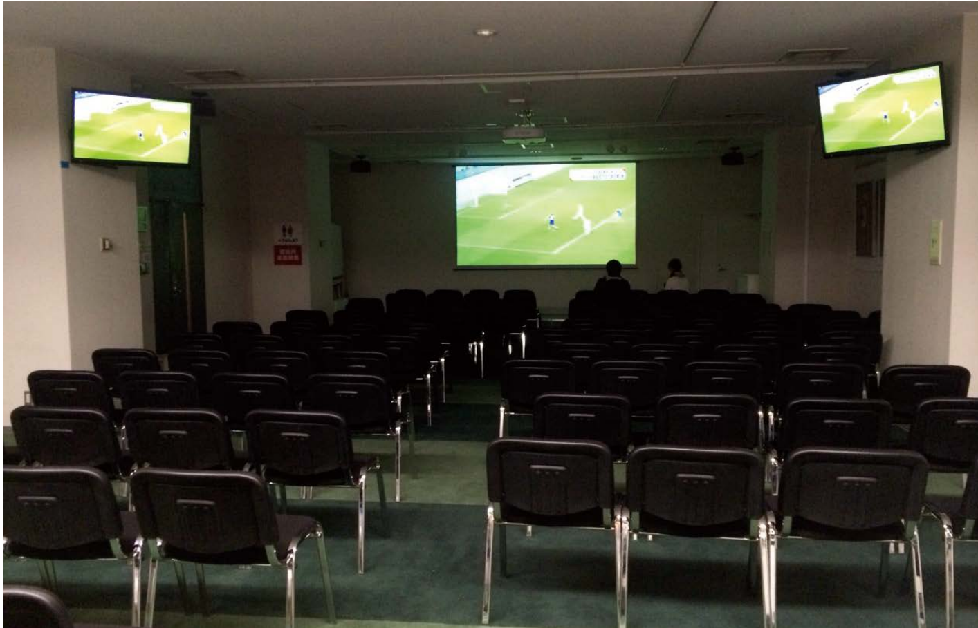
パブリックビューイング