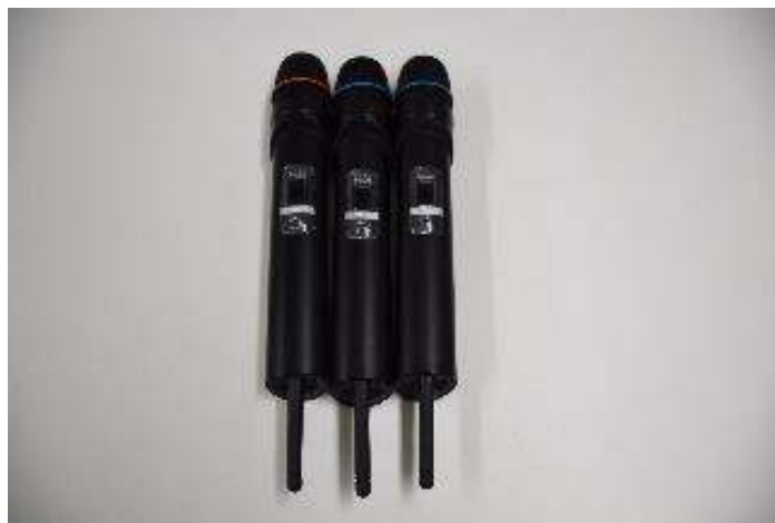
ワイヤレスマイク